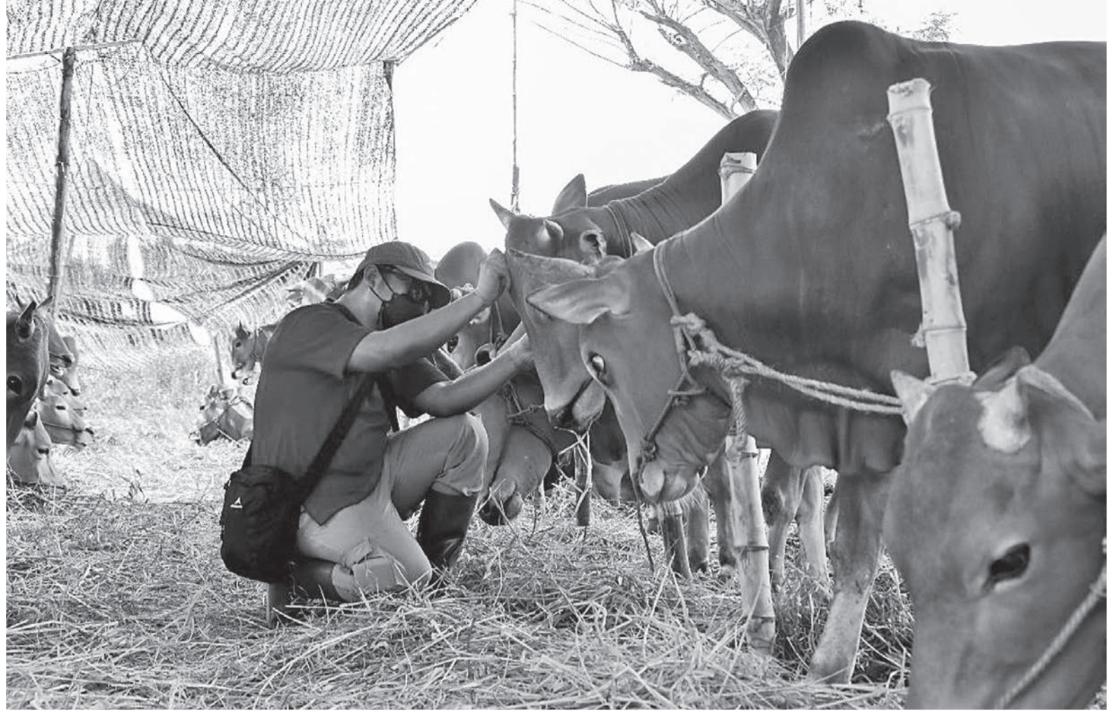
PERIKSA KESEHATAN HEWAN - Petugas kesehatan hewan memeriksa hewan ternak di salah satu lapak menjelang Idul Adha 2024 lalu. Dinas Ketahanan Pangan dan Pertanian (DKPP) Kota Surabaya memperketat pengawasan para pedagang yang akan membuka lapak hewan kurban menjelang Idul Adha 1446 H.

"Dalam waktu dekat MUI Banyuwangi akan menggelar Ijtima Ulama untuk membahas persoalan keagamaan sekaligus keumatan sebagaimana persoalan polemik minimarket ini dalam perspektif agama. Ini penting sebagai panduan bersama," ungkapnya. (fla)