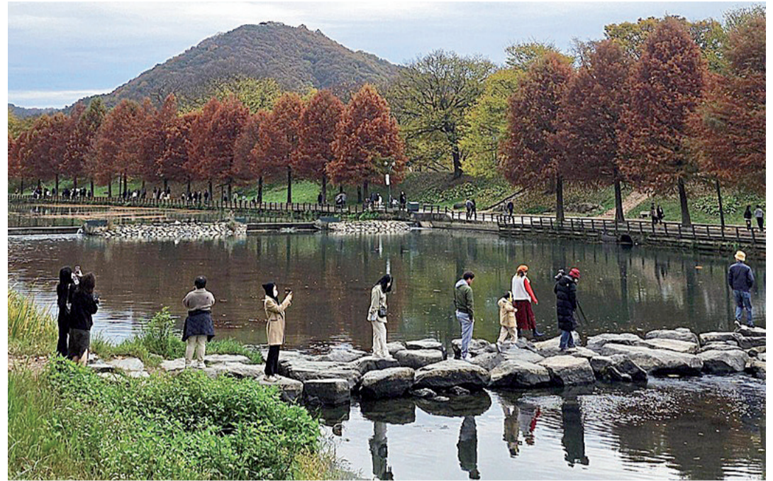
Jembatan di Sebelum Pintu Masuk Juknokwon

Di tengah maraknya Hallyu wave, budaya Korea Selatan seperti musik dan drama makin populer di Indonesia maupun dunia. Korea pun menjadi destinasi favorit wisatawan. Seoul dan Busan mungkin sudah familiar di telinga. Namun, pernahkah mendengar tentang Juknokwon?