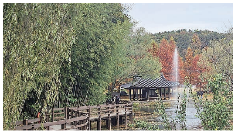
Taman di Dekat Pintu Belakang Juknokwon

JUKNOKWON adalah hutan bambu yang teduh dan hijau yang terletak di Kota Damyang. Lokasinya dekat dari Gwangju, tetapi jauh dari kebisingan. Di sini, pengunjung dapat menarik napas dalam-dalam dan merasakan udara segar di tengah bambu yang menjulang tinggi.