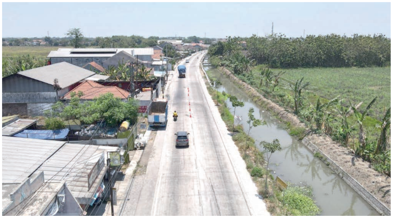
JALAN BETON - Pembangunan jalan beton di Kabupaten Sidoarjo terus berlanjut. Tahun ini setidaknya ada sembilan ruas jalan lagi yang bakal dibeton menggunakan uang APBD 2025.

Dan tidak kalah penting, Subandi meminta masyarakat untuk ikut menjaga dan merawat hasil pembangunan. Termasuk jalan beton yang telah dibangun selama ini dan nanti, diharapkan semua bisa ikut merasa memiliki sehingga turut menjaganya. (ufi)