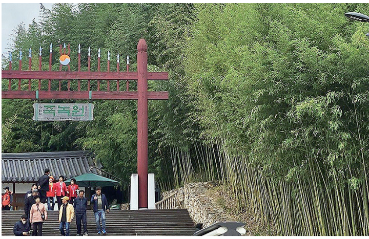
Pintu Masuk Juknokwon