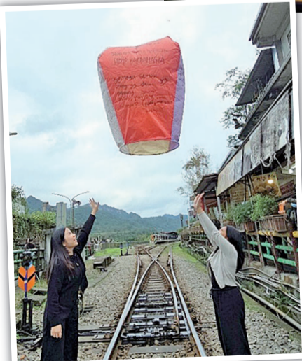
Penerbangan Lentera di Shifen Old Street

yang wajib dieksplorasi karena menawarkan beragam hiburan yang menarik dan variasi makanan yang lezat. Salah satu contoh adalah brand bubble milk tea terkenal Taiwan yang ada di pasar malam Ximending yaitu Xing Fu Tang.