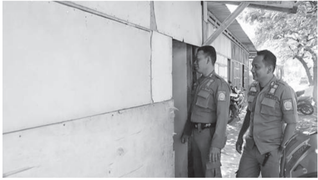
SOSIALISASI - Anggota Satpol PP saat sosialisasi penutupan prostitusi berbalut warung kopi di Jalan Raya Ponorogo-Trenggalek, Desa Demangan, Kecamatan Siman, Kabupaten Ponorogo, Jatim, Sabtu (3/5).

Lantaran akhir April 2025 lalu, dinas kesehatan (Dinkes) melakukan cek kesehatan kepada pekerja warung. Dan ada 29 pekerja warung dicek kesehatan. "29 pekerja warung ketika dicek kese-