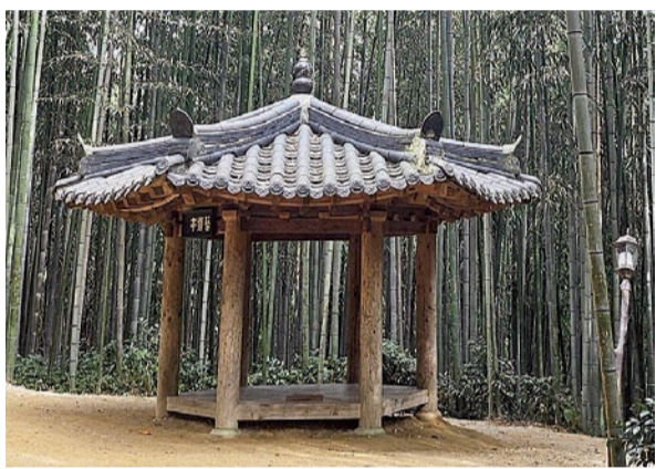
Gazebo Kayu di Dalam Juknokwon

Di tengah maraknya Hallyu wave, budaya Korea Selatan seperti musik dan drama makin populer di Indonesia maupun dunia. Korea pun menjadi destinasi favorit wisatawan. Seoul dan Busan mungkin sudah familiar di telinga. Namun, pernahkah mendengar tentang Juknokwon?